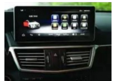
15. Anwendungsschnittstelle des Effektbild nach dem Laden