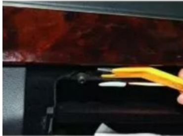
5. Hebeln Sie die Befestigungsklammern der zentralen Steuerungsblende der Lüftungsöffnung ab.