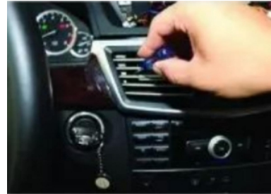
6. Heben Sie mit einem kleinen flachen Schraubendreher den Haken im Inneren der Lüftungsöffnung zur Mitte hin an