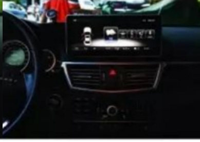
17. Hauptschnittstelle des Effektbildes nach dem Laden