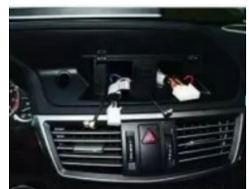
13. Installieren Sie unseren speziellen Frontraahmen und befestigen Sie die Befestigungsschrauben