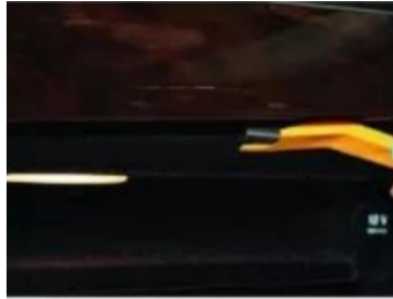
4. Hebeln Sie die Befestigungsklammern der zentralen Steuerungsblende der Lüftungsöffnung ab