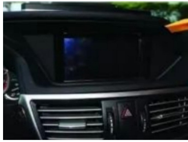
2. Hebeln Sie den Original-Bildschirmrahmen heraus