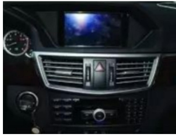
1. Zentrale Steuerung des Originalfahrzeugs