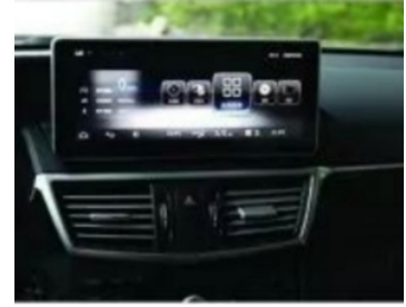
18. Hauptschnittstelle des Effektbildes nach dem Laden