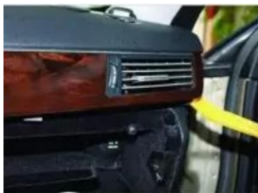
8. Hebeln Sie die zentrale Lüftungsblende des Originalfahrzeugs ab.