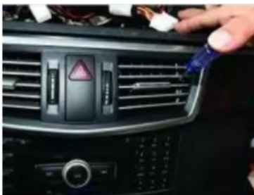
7. Heben Sie mit einem kleinen flachen Schraubendreher den Haken im Inneren der Lüftungsöffnung zur Mitte hin an