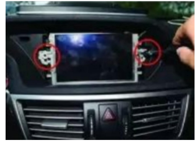
3. Entfernen Sie die Befestigungsschrauben des Original-Bildschirms.