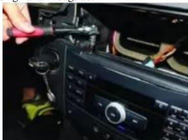
11. Drehen Sie die Befestigungsschrauben des CD-Players des Originalfahrzeugs ein wenig heraus und drücken Sie dann den CD-Player nach unten, um ihn zu entfernen