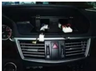
14. Befestigen unsern speziellen Rahmen