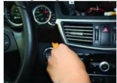
9. Hebeln Sie die zentrale Lüftungsblende des Originalfahrzeugs ab.