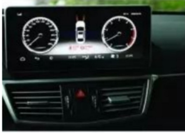
16. Instrumentenschnittstelle nach dem Laden