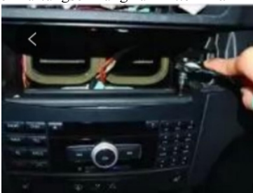
10. Drehen Sie die CD-Befestigungsschrauben des Originalfahrzeugs ein wenig heraus und drücken Sie dann nach unten, um den CD-Host zu entfernen